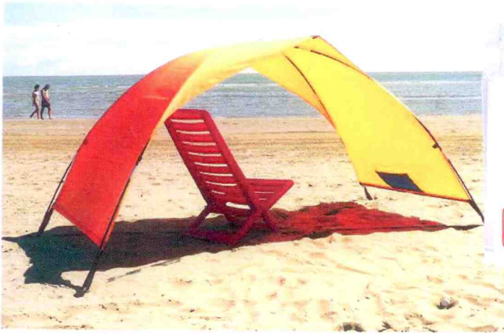
Innovation Solartent von ProSign AG.