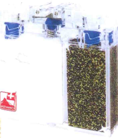
Swiss Spice Shaker: Gewürzstreuer von Think Industry Ltd.